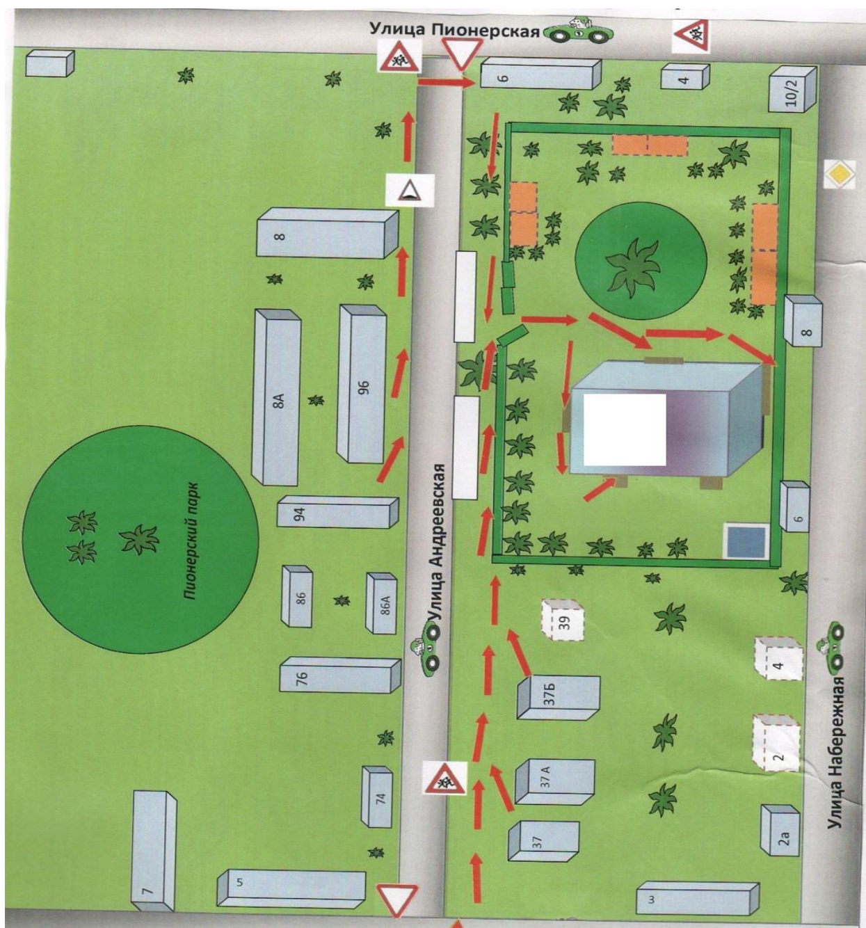
Схема организации дорожного движения в непосредственной близости от образовательного учреждения с размещением соответствующих технических средств, маршруты движения детей и расположение парковочных мест автотранспорта (корпус 2)