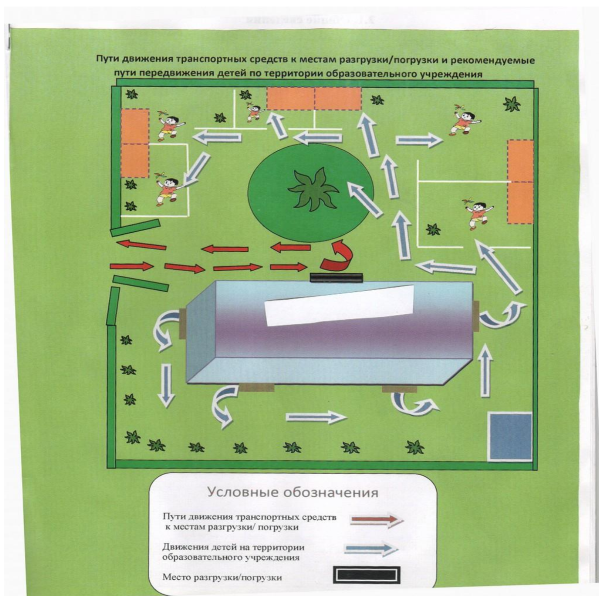
Пути движения транспортных средств к местам разгрузки/погрузки и рекомендуемые пути передвижения детей по территории образовательного учреждения (корпус 2)